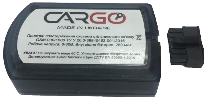
Рисунок 4. Зовнішній вигляд Cargo Pro 2