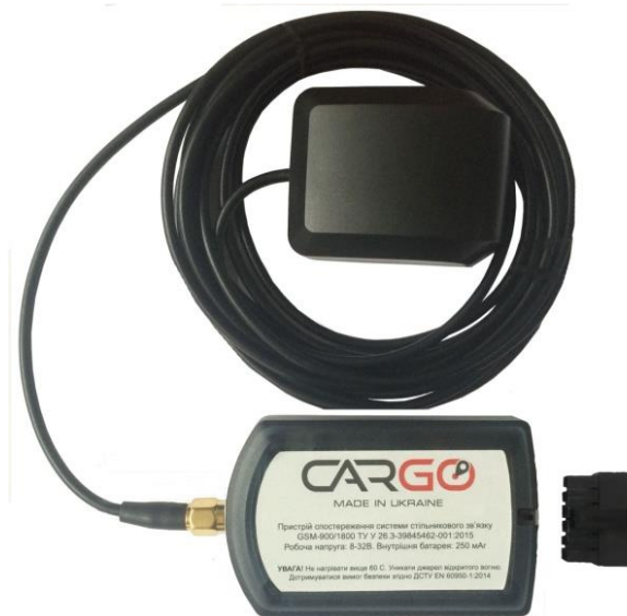
Рисунок 2. Зовнішній вигляд Cargo Light 2 (ext)\Cargo Mini 2 (ext) з підключеною антеною