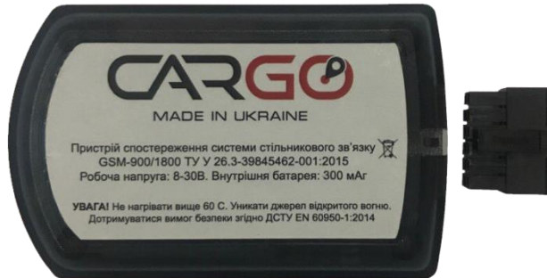
Рисунок 1. Зовнішній вигляд Cargo Light 2\Cargo Mini 2