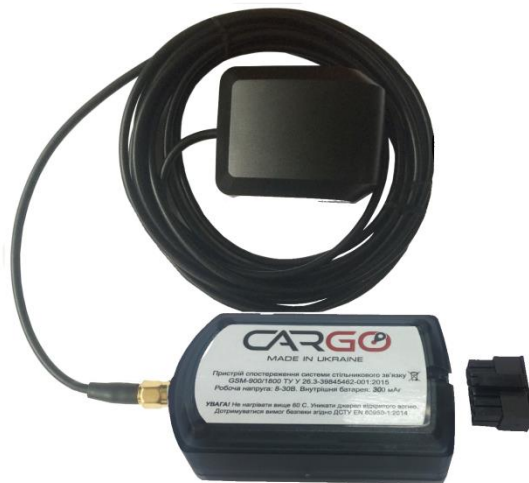
Рисунок 5. Зовнішній вигляд Cargo Pro 2 (ext) з підключеною антеною